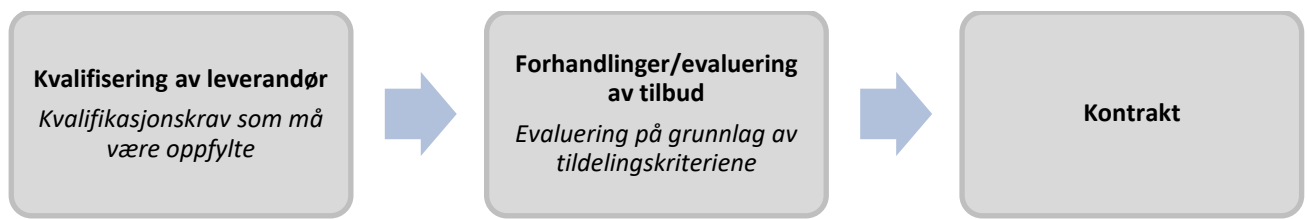
Figur 1. Anskaffelsens faser

Flytoget forbeholder seg retten til å gjennomføre forhandlinger uten fysisk møte f.eks. ved videokonferanse eller per telefon. Det vil bli ført protokoll fra slike forhandlinger.